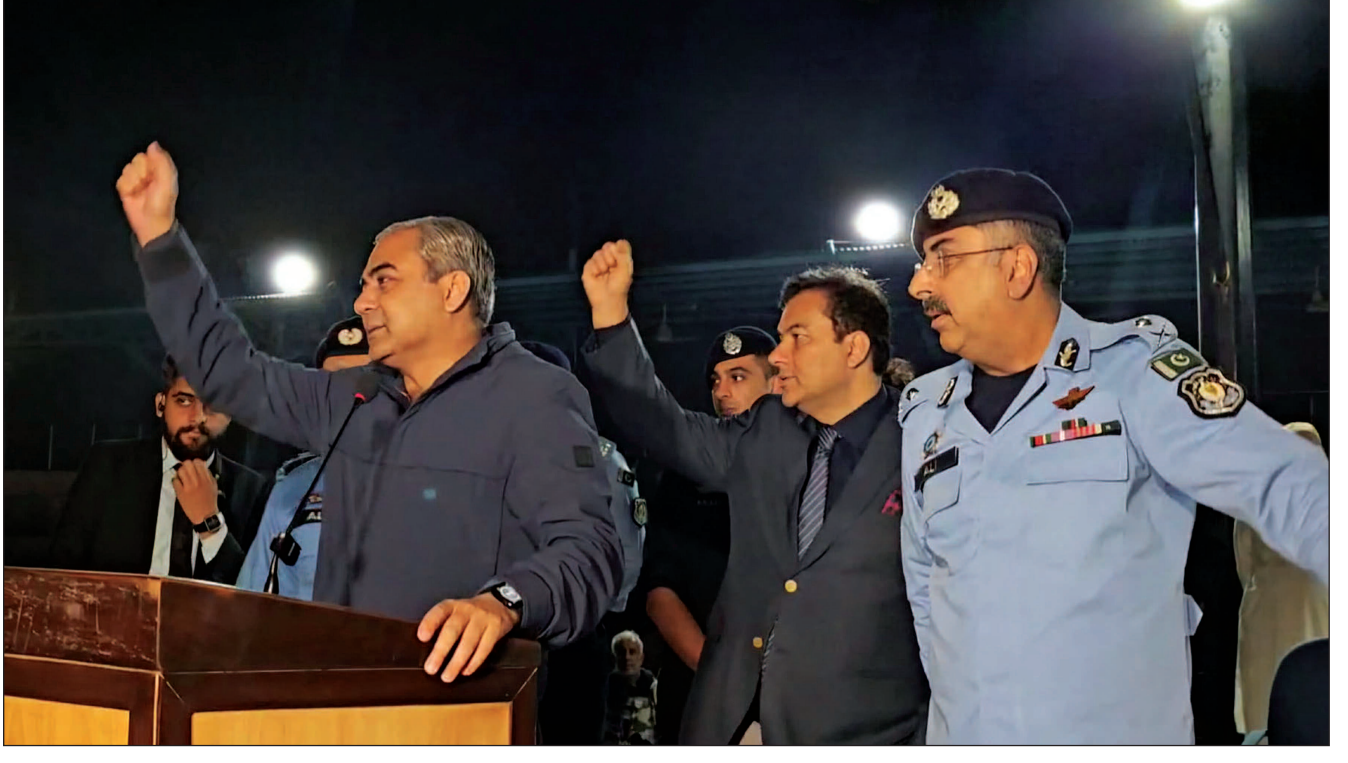
ISLAMABAD: Federal Interior Minister Mohsin Naqvi addressing the ICT police to boost their morale in Police Lines.

As per details, pilgrims enrolled in the federal government's Hajj program will benefit from financial relief of Rs 1.24 billion following the recent announcement of a relief package that reduces airfares by $50 per individual