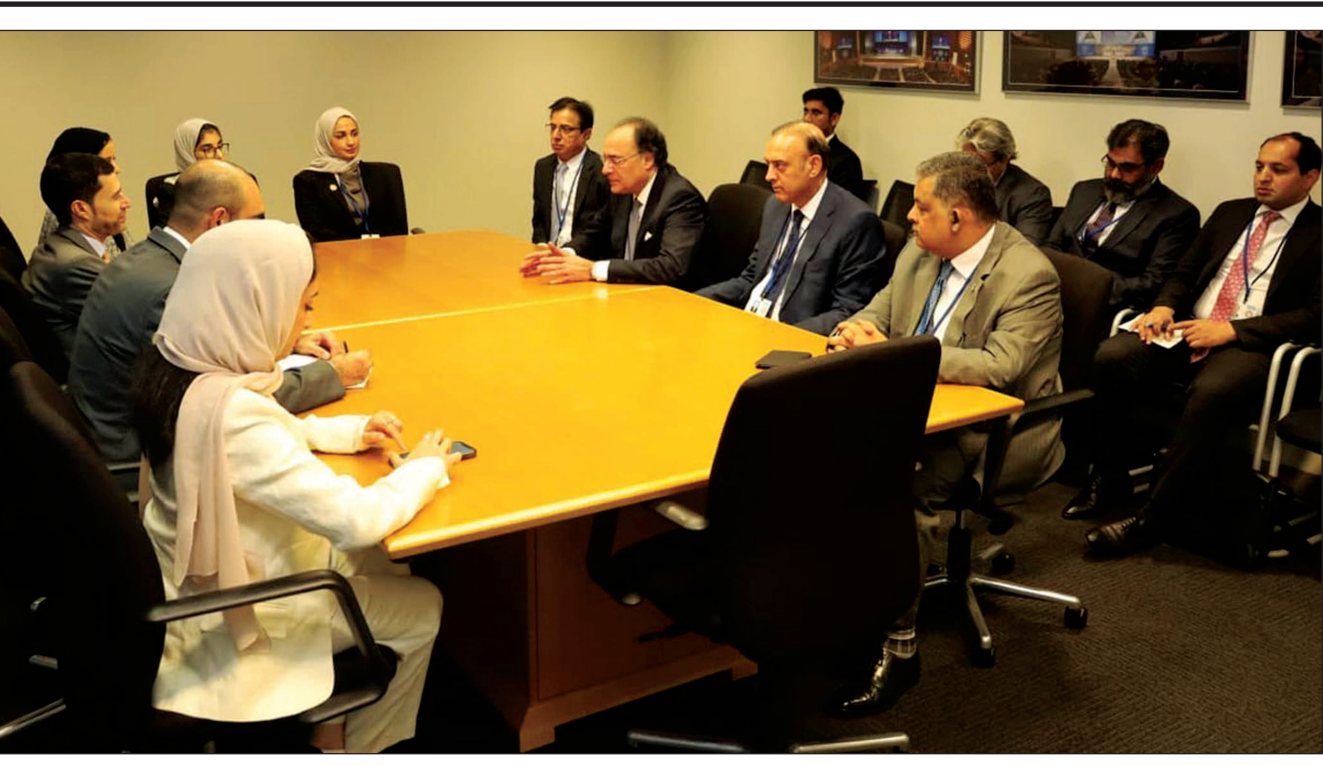
Washington DC: Federal Minister for Finance and Revenue Senator Muhammad Aurangzeb held a meeting with His Excellency Mohamed Bin Hadi Al Hussaini, Minister of State for Financial Affairs, UAE. (Story on page 1)

They emphasized the need for regular coordination and communication. Both the ministers also discussed that effective plant management was essential for sustaining energy output and meeting the growing demands of the region. INP