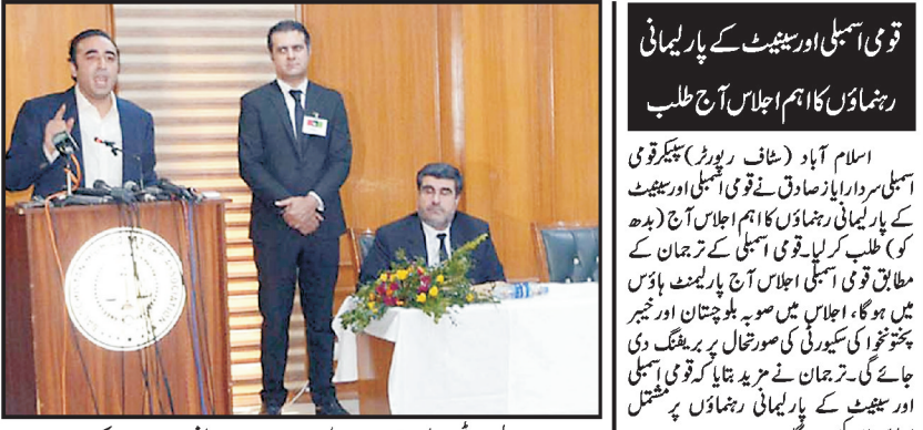
چیئر مین پیپلزیار ٹی بلاول بھٹوزرداری بلوچیتان بارایسوی ایشن سےخطاب کررہے ہیں

اس لیے اس کا مطلب سب سے زیادہ مجھے پیت ہے، آپ رضار بانی مصدر زرداری سے بوچیس وہ سیٹی میں موجود ہیں ۔ بلاول بیٹو نے کہا کہ آج