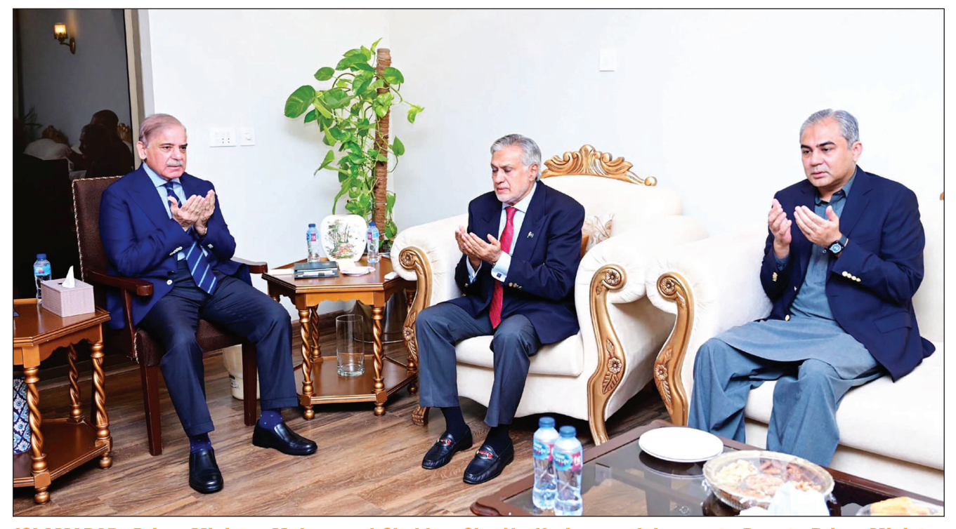
ISLAMABAD: Prime Minister Muhammad Shehbaz Sharif offering condolences to Deputy Prime Minister and Foreign Minister Ishag Dar on the demise of his elder brother.

In his address on the occasion, Federal Minister for Law and Justice and Human Rights, Senator Azam Nazeer Tarar, paid tribute to the invaluable contributions of senior citizens and reiterated the government's commitment to their well-being and dignity. Reflecting on the challenges faced by older persons, the minister emphasized that climate change had exacerbated many of the issues impacting the elderly, particularly in rural and underserved areas. He stated, "Our older population bears the brunt of climate change, and it is crucial that we address their vulnerabilities through inclusive policies that ensure their protection and resilience." Building on this, the minister highlighted the need for smarter resource management, especially in the conservation of water. "We must commit ourselves to water conservation, not just for our own sake, but to leave a legacy of sustainability for future generations," he remarked and said, our elders have made countless sacrifices for us; now it is our turn to give them the care, respect, and attention they deserve. He highlighted that safeguarding the rights of older persons required a unified societal effort, rather than being viewed as an individual task. By doing so, he emphasized, we not only address the specific needs of the elderly but also contribute to a more inclusive and resilient society capable of tackling broader issues like climate change and resource management. APP