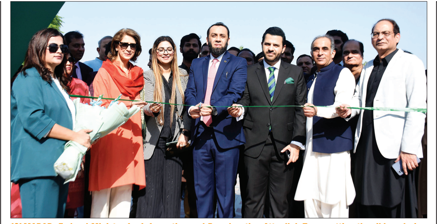
ISLMABAD: Federal Minister for Information and Broadcasting Attaullah Tarar cutting the ribbon during inauguration ceremony of Media Facilitation Centre at Pak-China Friendship Center ahead of Shanghai Cooperation Organisation (SCO) Summit 2024, in the Federal Capital. ONLINE

As part of a beautification drive, various statues have been installed at key intersections. Government offices, private business centers, and buildings have also been revamped, ready to greet the visiting dignitaries. Private businesses, including plazas, petrol stations, and restaurants, are prepared to accommodate the needs of international guests during the summit. At night, the city offers an even more impressive view, with lights illuminating the skyline and key areas across the city. APP