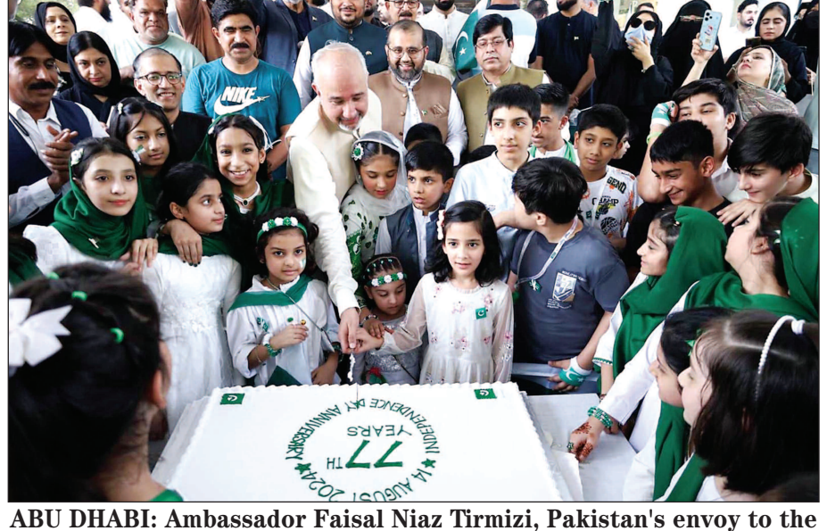
United Arab Emirates along with school, children cutting cake on occasion of 77 Independence Day celebration at Pakistan embassy. INP

As per details, the committee, chaired by Amin ul Haq, has asked Rehman to provide reasons for the disruption in social media services. The committee has also requested details about the nationwide internet service disruption and weak mobile signals. The Attorney General of Pakistan has also been invited to the committee's meeting, scheduled for August 21 at the Parliament House. It is pertinent to mention here that internet services are currently down across Pakistan, with the exact cause of the disruption yet to be identified. INP